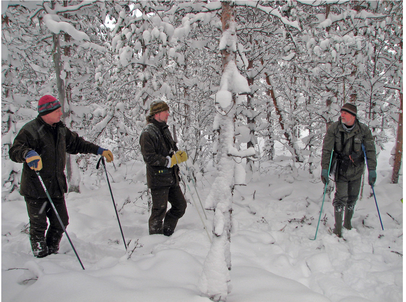
Maijannevan ennallistamisalue ennen ennallistamistoimenpiteitä.