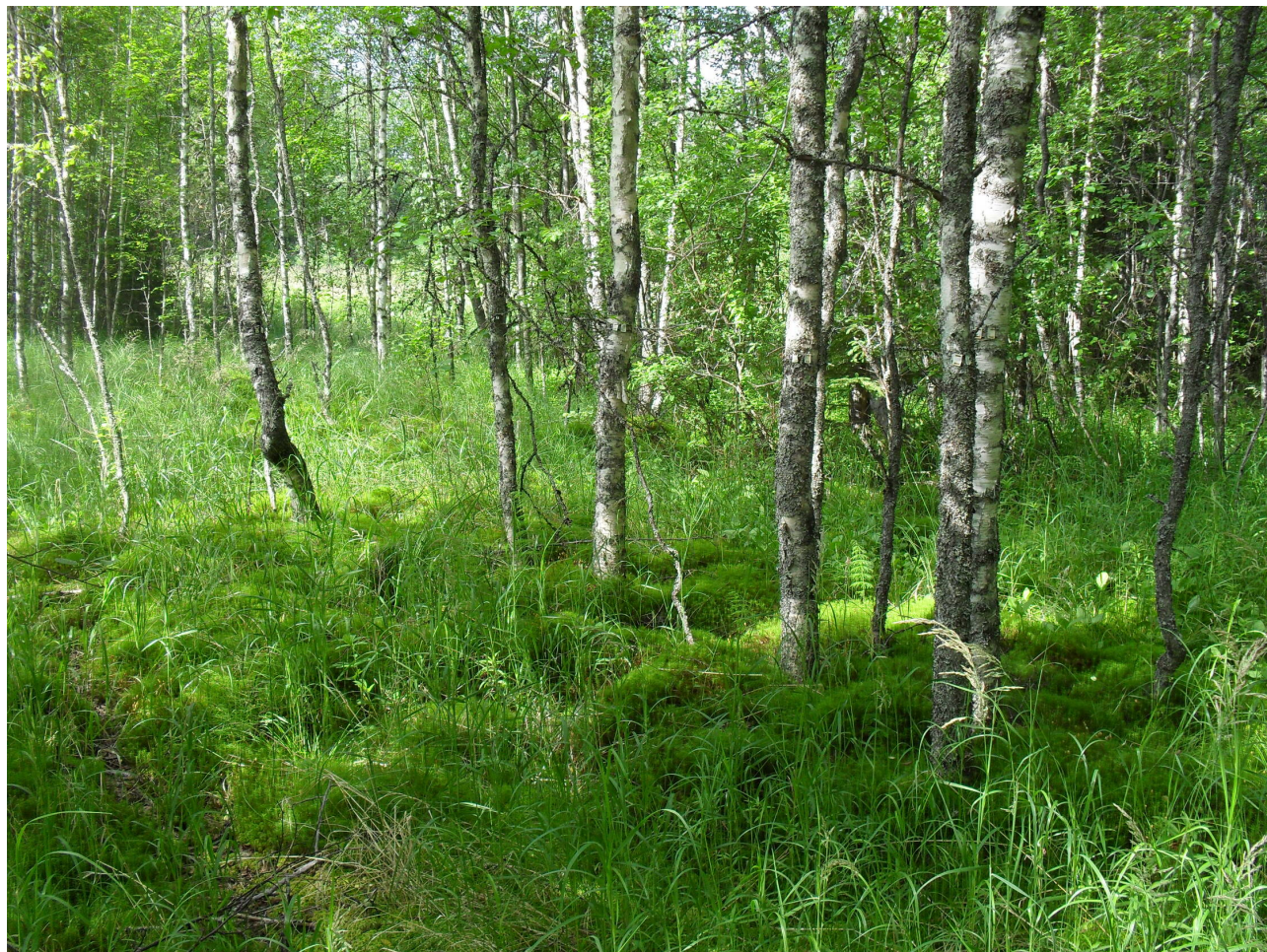
Kosteikkojen laidalla säästetään erityisesti lehtipuita.