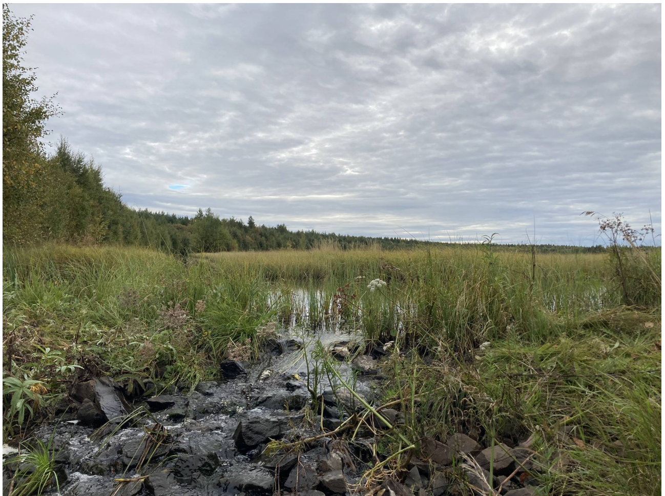
Kosteikon alapuolelle rakennettu pohjapato.

Patovaihtoehtoja voidaan myös yhdistellä. Esimerkiksi kalojen kulun turvaamiseksi voidaan kosteikon patorakenteena käyttää pohjapatoa mutta liittää siihen munkki, jolloin kosteikon tyhjentäminen kasvillisuuden hallitsemiseksi on mahdollista. Putkipato sopii kosteikon patorakenteeksi vesiensuojelun virtaamansäätörakenteena toimimisen lisäksi.