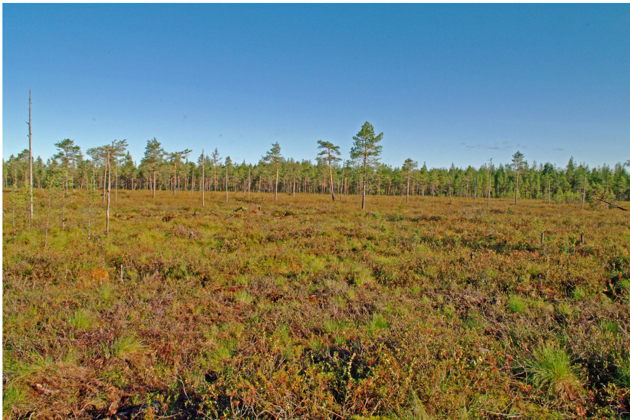
Maijannevan ennallistamisalue ennallistamistoimenpiteiden jälkeen.