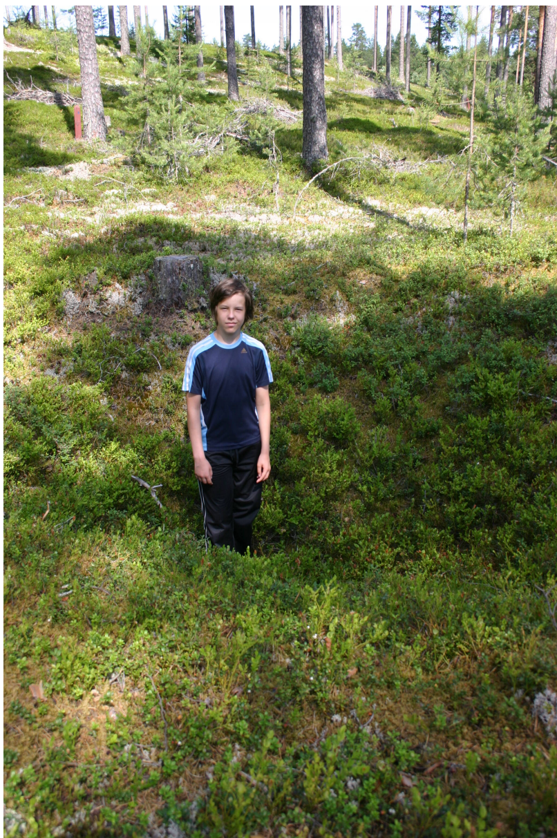
Fångstgroparna utgör en del av jakthistorien